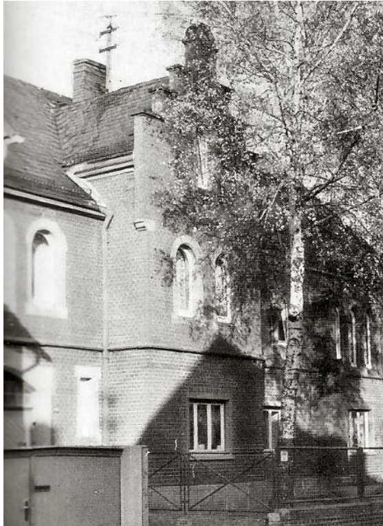
Das Gebäude der ehemaligen Synagoge um 1970

Das Synagogengebäude in der Rheinstraße 49 wurde 1941 von der Gemeinde Egelsbach samt Grundstück für 5.000 Reichsmark "gekauft", wobei der Betrag auf ein Sperrkonto bei der Bezirkssparkasse Langen eingezahlt wurde. Die Synagoge wurde danach als Unterbringungsort von ausländischen Zwangsarbeitern und Kriegsgefangenen zweckentfremdet. Nach 1945 kam das Gebäude - vermutlich nach Klärung des Restitutionsverfahrens - in Privatbesitz und wurde zu einem Wohnhaus umgebaut.