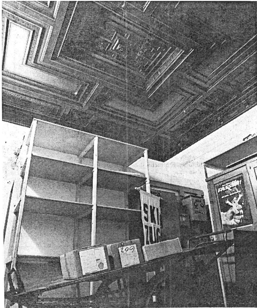
Das ehemalige Fürstenzimmer mit der noch gut erhaltenen Kassettendecke ist heute halb Abstellkammer, halb Schaltzentrale des Egelsbacher Bahnhofes.