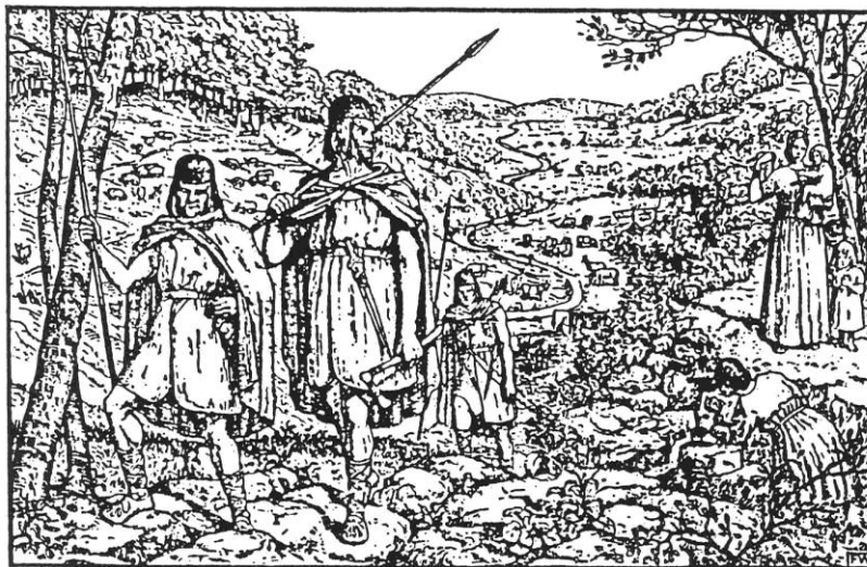
Bronzezeitliche Jäger und Viehzüchter

Dem Prähistoriker ist die Bayerseich bekannt. 200-300 Meter südlich von der Rutschbach bei der Bayerseich, aber schon auf Arheilger Gemarkung und bei dem Forsthaus Bayerseich auf Erzhäuser Gemarkung ist ein Gräberfeld aus der Hügelgräber-Bronzezeit (s.a. Gräber aus der Bronzezeit bei dem Forsthaus Bayerseich von Hofrat F. Kofler Archiv f. Hess. Geschichte u. Altertumskunde, Neue Folge III. Bd. 1902 und Schumacher Siedlungsgesch. I. Bd. S. 65 u.a.).