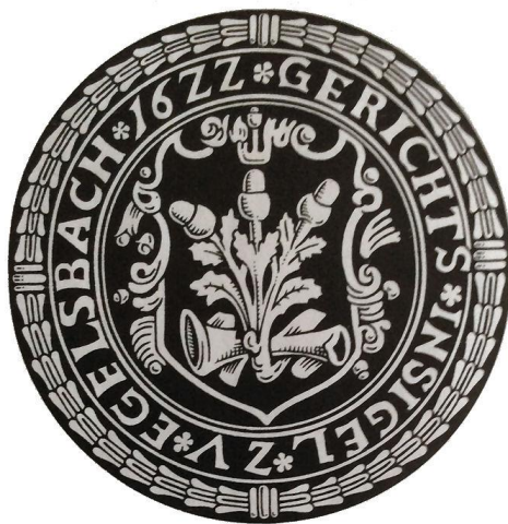
Egelsbacher Gerichtssiegel von 1622

Egelsbach wechselte mehrfach den Besitzer, wurde bis 1600 von den Isenburgern regiert und kam dann unter hessische Oberherrschaft. Aus den Jahren Anfang des 30-jährigen Krieges existieren Abdrücke eines Gerichtssiegels. Der Stempel selbst ist aber verloren gegangen. Ein anders gestaltetes Siegel ist aus dem Jahre 1708 überliefert. Hier erwächst ein Eichbaum mit 3 Eicheln aus einem Herz. Der Eichenzweig weist auf die ehemalige Zugehörigkeit zum Reichforst Dreieich hin. Dieses Wappen wurde dann zum Vorbild eines 1953 verliehenen Gemeindewappens.